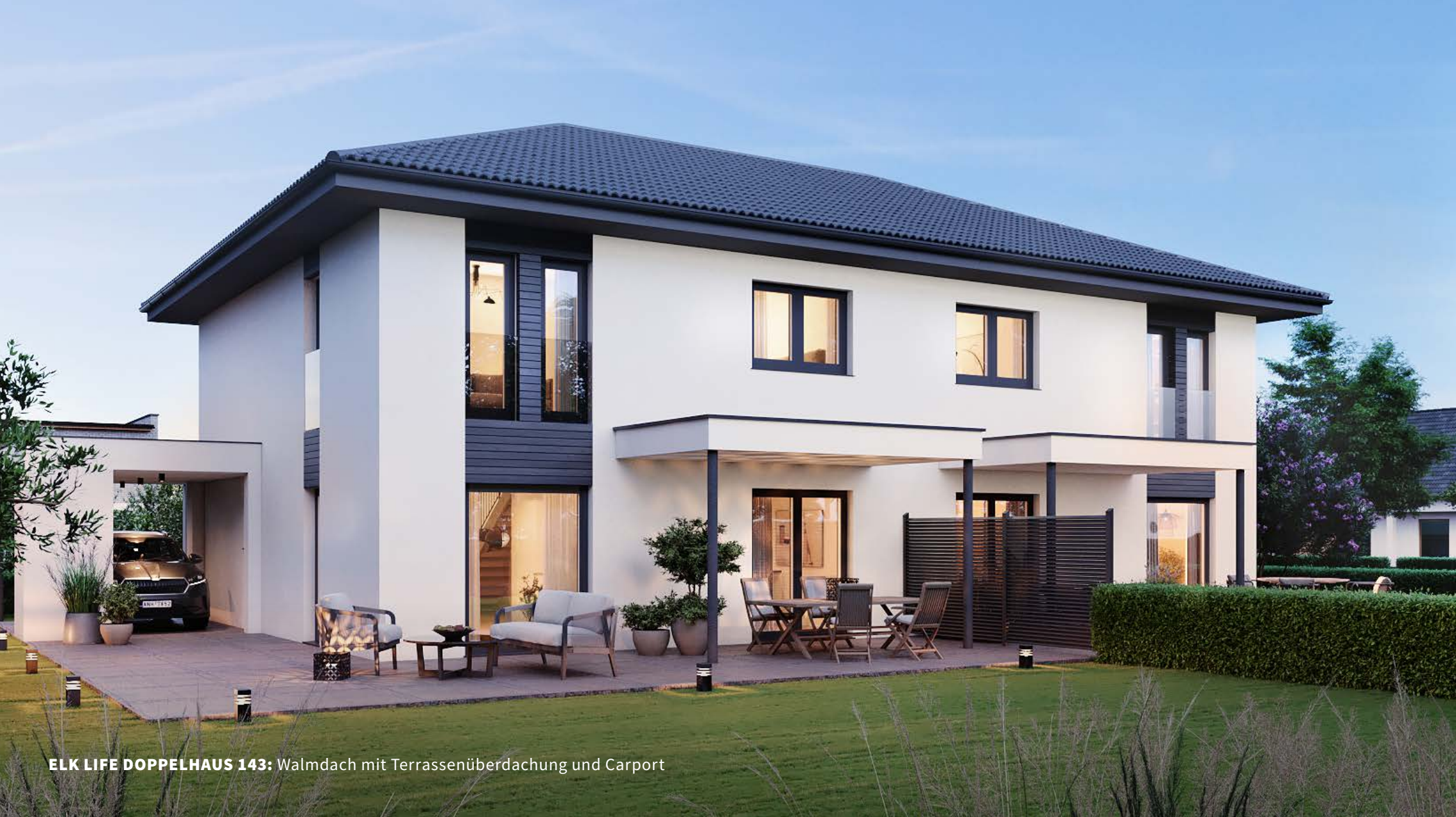
ELK LIFE DOPPELHAUS 143: Walmdach mit Terrassenüberdachung und Carport