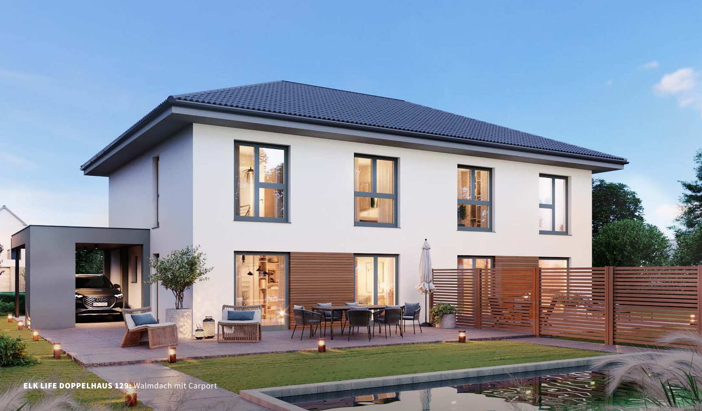
ELK LIFE DOPPELHAUS 129: Walmdach mit Carport