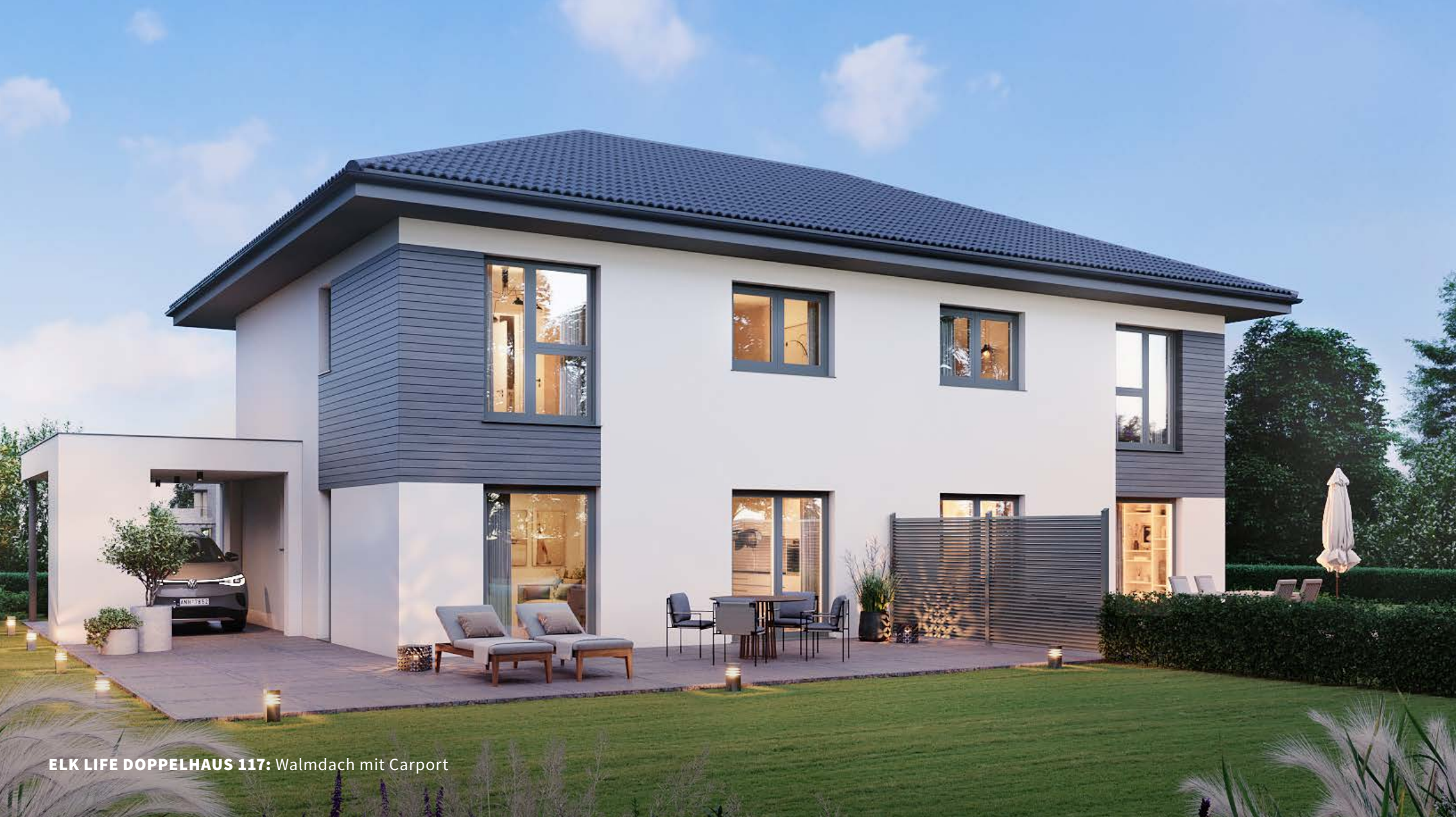
ELK LIFE DOPPELHAUS 117: Walmdach mit Carport